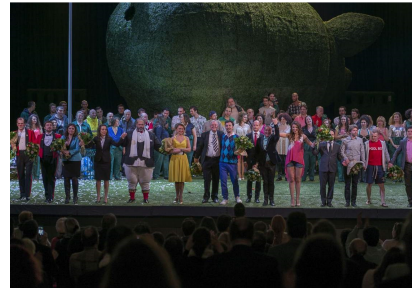
Aplauze la final